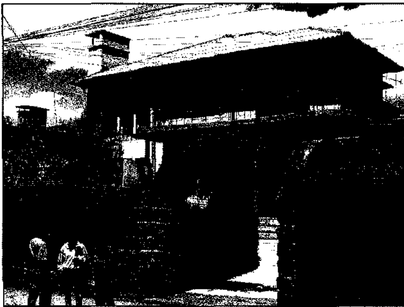
La sede de Sigvol y de la CVX

Queremos proponer a las comunidades nacionales que se integren también a esta experiencia de servicio como cuerpo en misión con quienes más lo necesitan viajando hasta